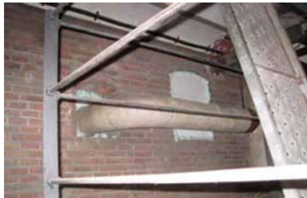
Figura 5. Identificación de posibles entradas de aire.

elementales a confinar es fundamental, para cumplir los cálculos teóricos, anular todas las posibles entradas de aire (figura 5) y en su caso, aislar y anular el servicio de los sistemas de ventilación y climatización. En función del riesgo potencial de los materiales con amianto existentes puede darse el caso que estos trabajos previos deban realizarse con riesgo de exposición al amianto, con todo lo que ello conlleva: equipo de descontaminación personal, equipos de protección respiratoria, etc.