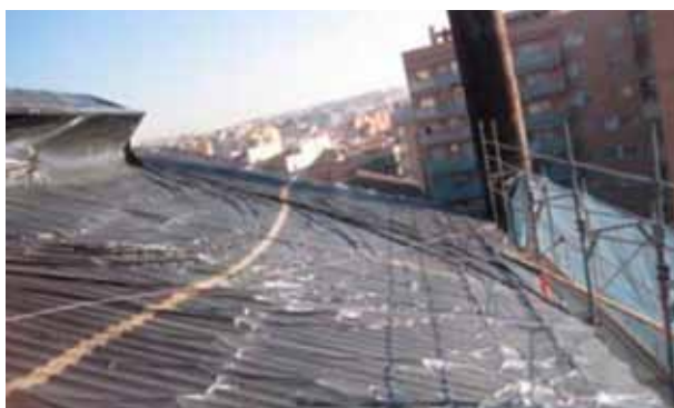
Figura 4. Trabajos previos al confinamiento

Los trabajos previos al montaje (figura 4) del confinamiento son clave para alcanzar un aislamiento del exterior lo más estanco posible. Una vez definidas las zonas