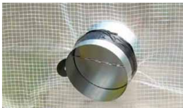
Figura 2. Compuerta anti-retorno

La compuerta anti-retorno de acero galvanizado (véase figura 2) permite la entrada de aire limpio al confina-