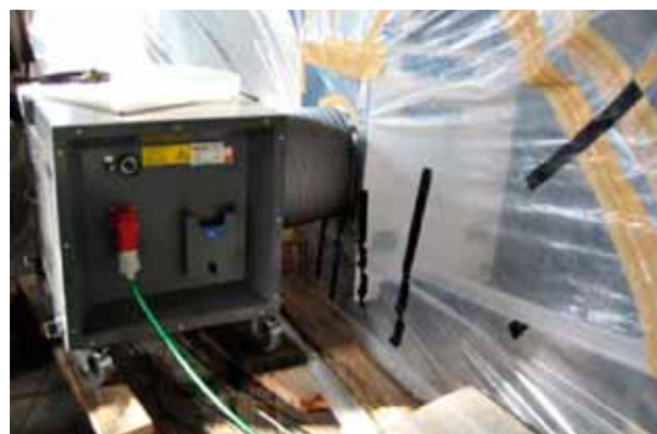
Figura 7. Localización de los depresores

Una manera de facilitar el mantenimiento de los equipos de depresión es reducir el régimen de funcionamiento de todos los depresores y poner en marcha el depresor de reserva. De este modo se reducen las revoluciones por minuto de todos los depresores y el mantenimiento es más fácil. Basta con desconectar un depresor y poner a pleno rendimiento todos los demás. La capacidad del depresor de reserva se calcula de forma que pueda cubrir el fallo de un equipo depresor