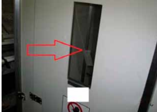
Figura 1. Efecto de la depresión en la esclusa

Obsérvese en la figura 1 el efecto de la depresión en la esclusa. Existe una corriente de aire continua a través de las ventanas de las esclusas. Para unas esclusas tipo se estima en 400\text{m}^3/\text{h} y 350\text{m}^3/\text{h} , respectivamente para la unidad del residuo y de las personas.